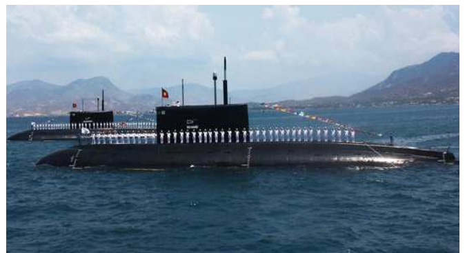
Sous-marin de la classe Kilo en service dans la marine vietnamienne.

C'est dans ce contexte qu'un important programme de réarmement a été entrepris par la marine vietnamienne, principalement auprès de la Russie qui reste son fournisseur