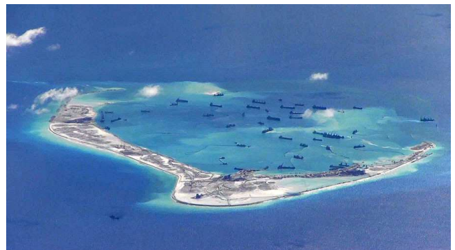
Récif de Subi dans les Paracels, militarisé par la Chine.

Le Vietnam, qui subit le plus fortement l'expansion chinoise et s'inquiète de la diminution de ses ressources halieutiques, tente de s'appuyer sur l'ASEAN pour organiser une opposition commune contre Pékin.